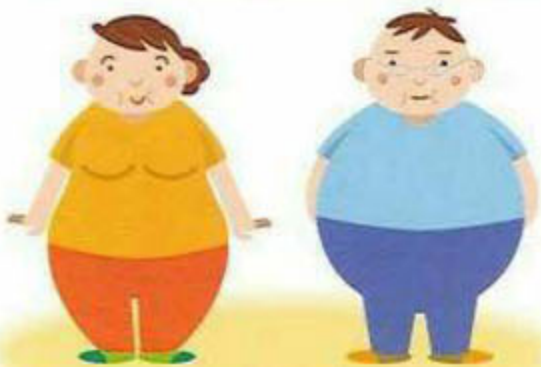
下腹部、お尻、太ももに脂肪が つくタイプ。皮下脂肪が多い。